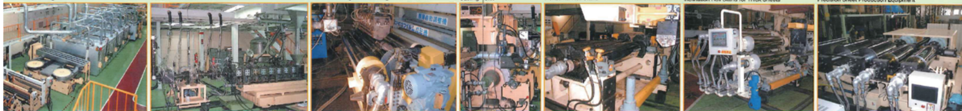
精密シート装置 Precision Sheet Production Equipment